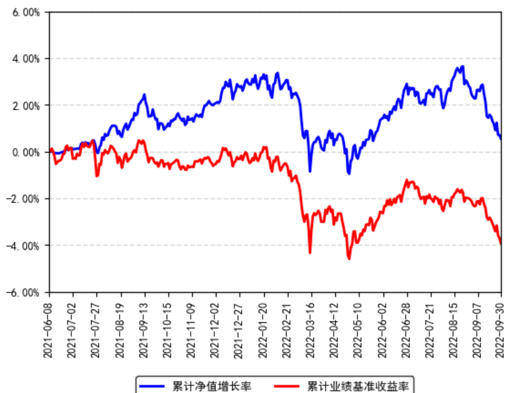
南方宝恒混合A累计净值增长率与同期业绩比较基准收益率的历史走势对比图