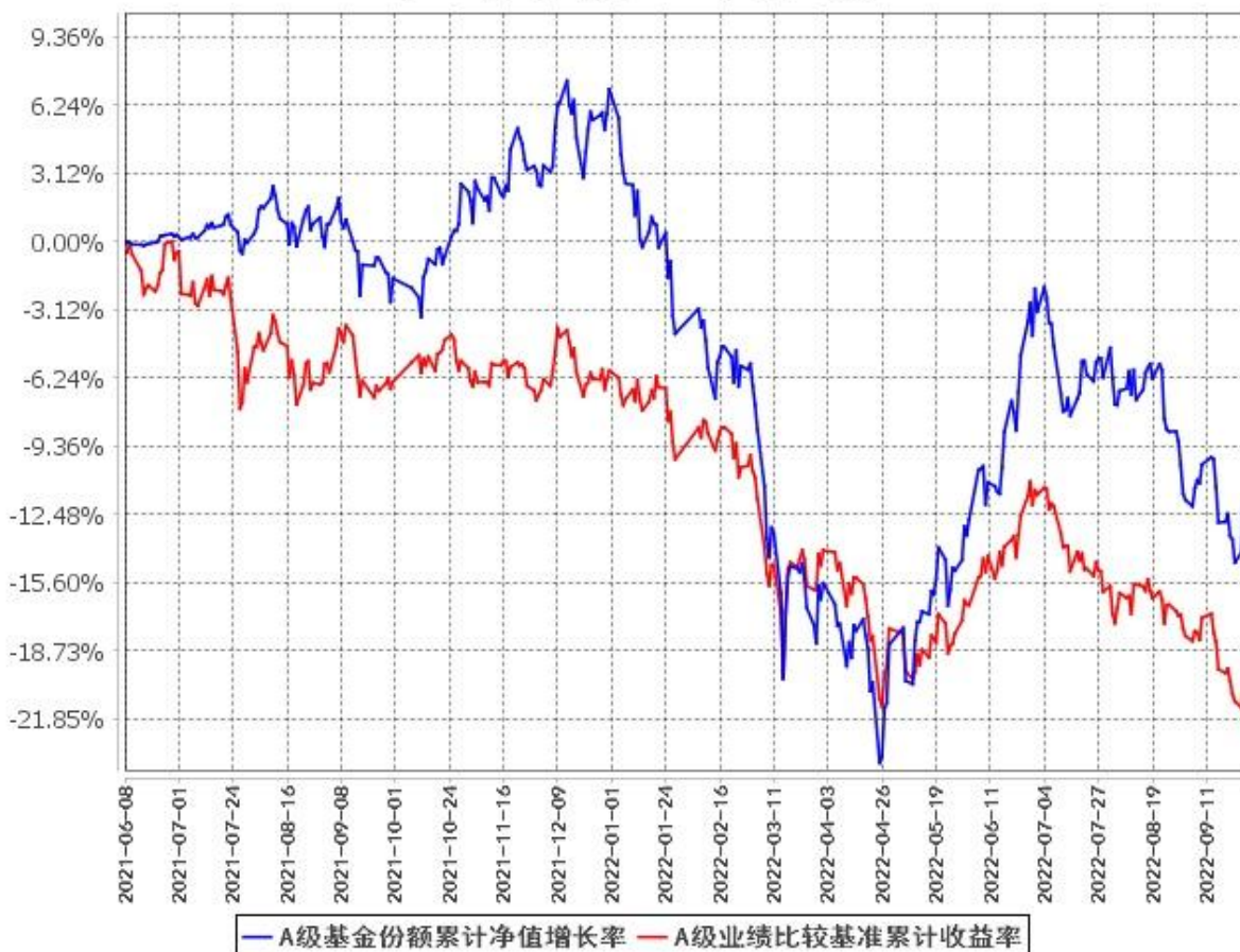
A级基金份额累计净值增长率与同期业绩比较基准收益率的历史走势对比图 (2021年6月8日至2022年9月30日)