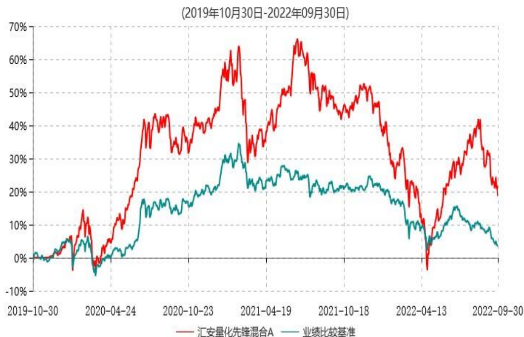
汇安量化先锋混合A累计净值增长率与业绩比较基准收益率历史走势对比图