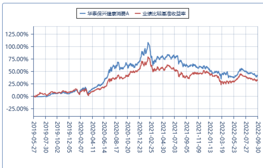
华泰保兴健康消费 A