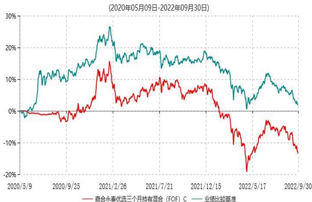
嘉合永泰优选三个月持有混合（FOF）C 累计净值增长率与业绩比较基准收益率历史走势对比图