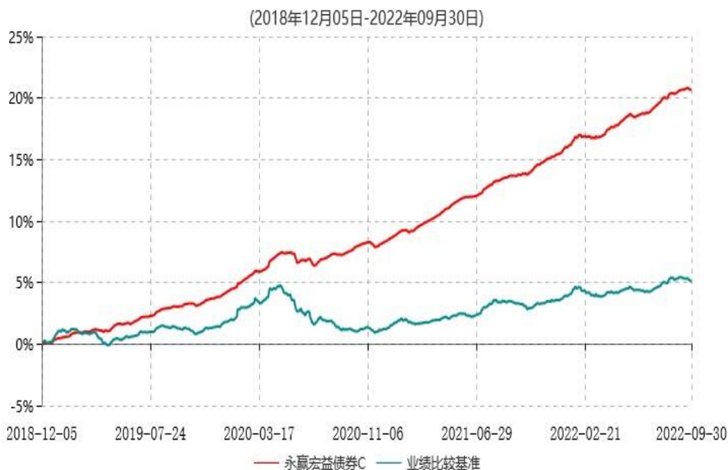
永赢宏益债券C累计净值增长率与业绩比较基准收益率历史走势对比图