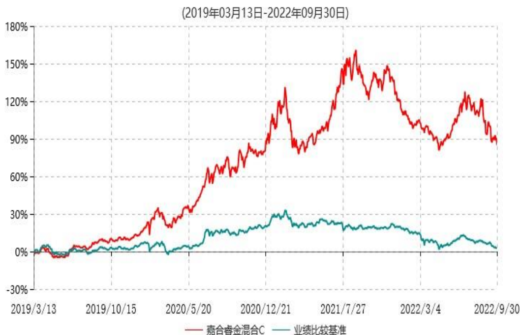
嘉合睿金混合C累计净值增长率与业绩比较基准收益率历史走势对比图

注：1、本基金于 2019 年 3 月 13 日由“嘉合睿金定期开放灵活配置混合型发起式证券投资基金”转型而来。