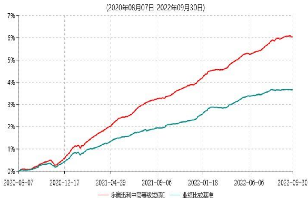
永赢迅利中高等级短债E累计净值增长率与业绩比较基准收益率历史走势对比图