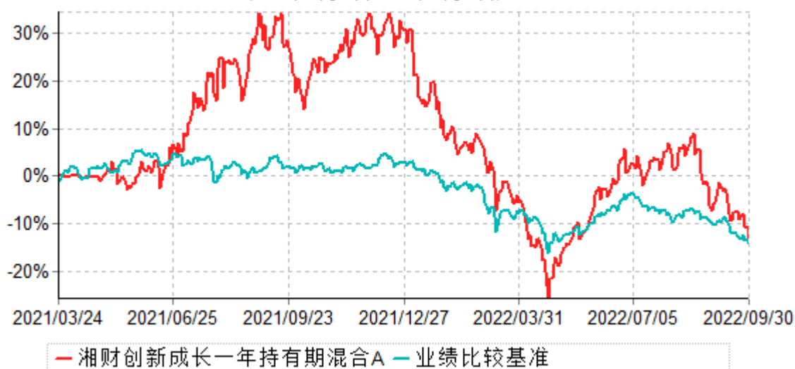
湘财创新成长一年持有期混合A累计净值增长率与业绩比较基准收益率历史走势对比图 (2021年03月24日-2022年09月30日)