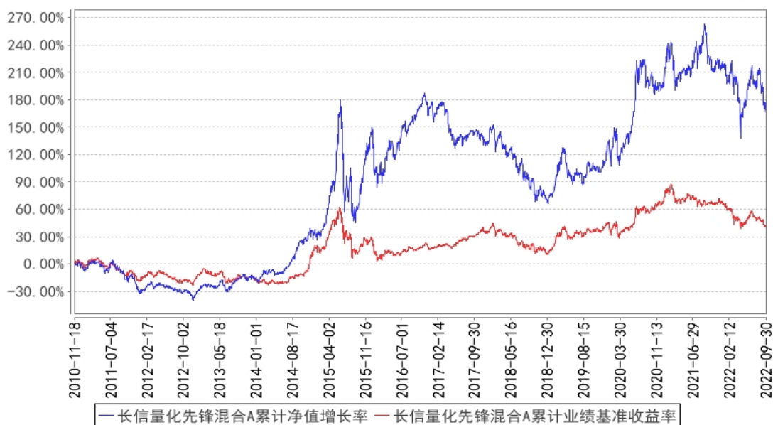
长信量化先锋混合A累计净值增长率与同期业绩比较基准收益率的历史走势对比图