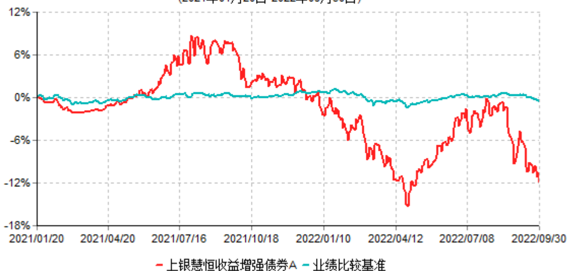
上银慧恒收益增强债券A累计净值增长率与业绩比较基准收益率历史走势对比图 (2021年01月20日-2022年09月30日)