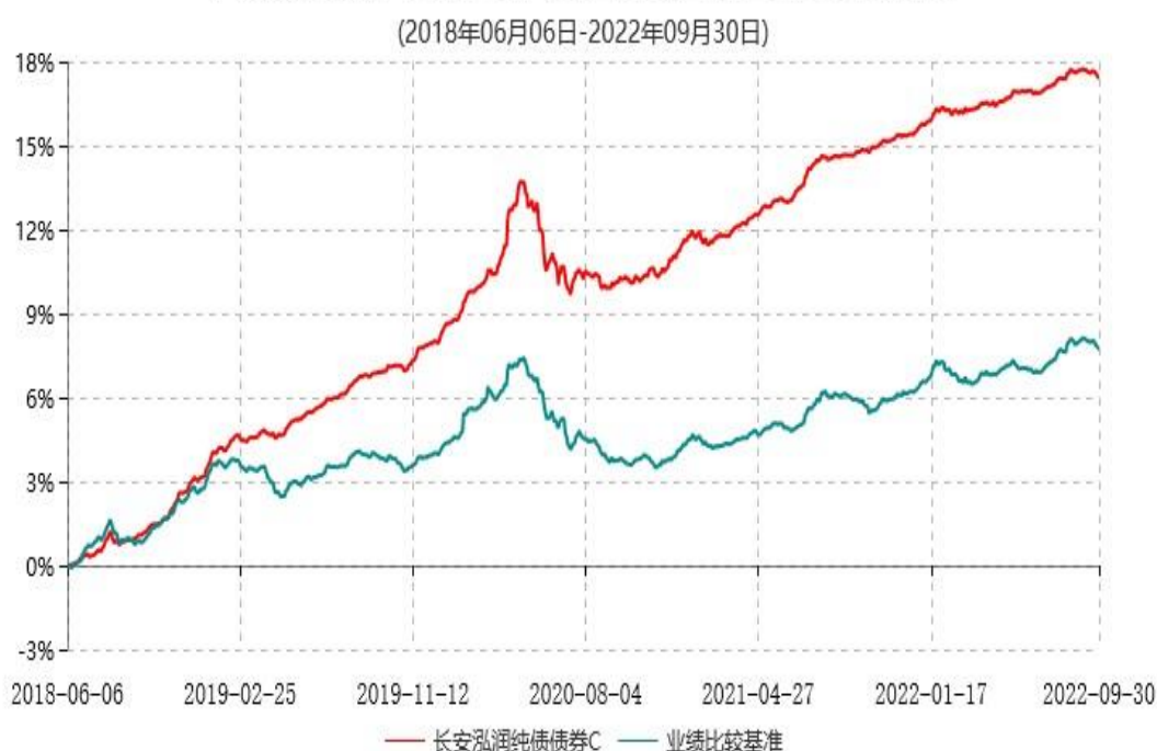
长安泓润纯债债券C累计净值增长率与业绩比较基准收益率历史走势对比图

根据基金合同的规定，自基金合同生效日起 6 个月内基金各项资产配置比例需符合基金合同要求。本基金在建仓期结束后，各项资产配置比例已符合基金合同有关投资比例的约定。基金合同生效日至报告期末，本基金运作时间已满一年。图示日期为 2018 年 6 月 6 日至 2022 年 9 月 30 日。