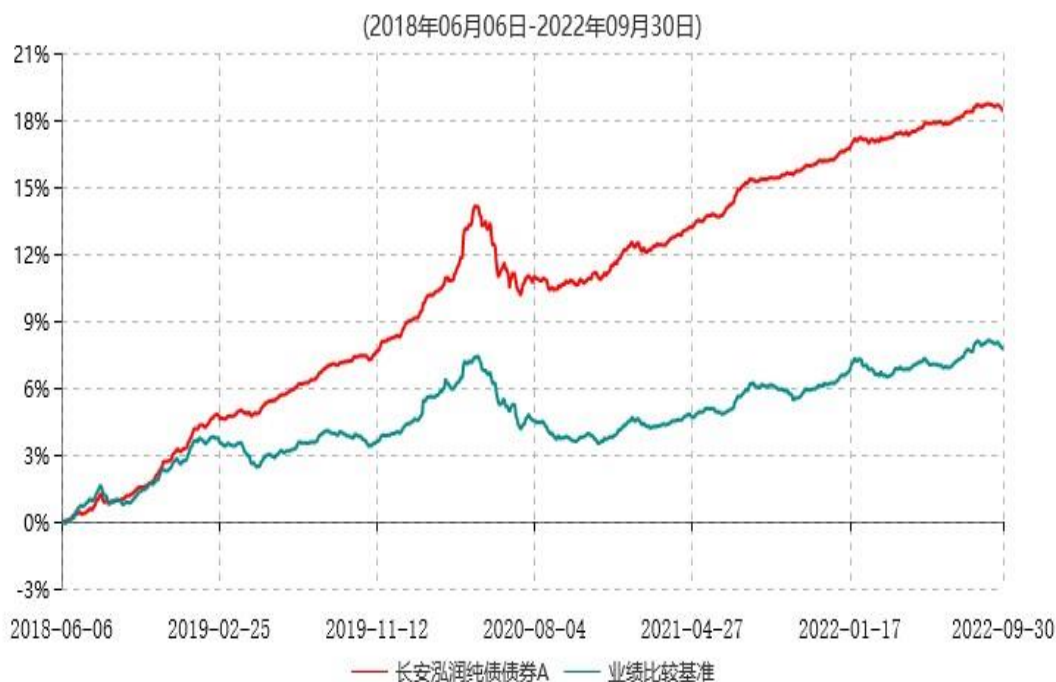
长安泓润纯债债券A累计净值增长率与业绩比较基准收益率历史走势对比图

根据基金合同的规定，自基金合同生效日起 6 个月内基金各项资产配置比例需符合基金合同要求。本基金在建仓期结束后，各项资产配置比例已符合基金合同有关投资比例的约定。基金合同生效日至报告期末，本基金运作时间已满一年。图示日期为 2018 年 6 月 6 日至 2022 年 9 月 30 日。