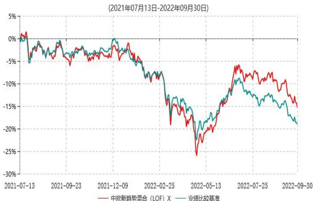
中欧新趋势混合 (LOF) X 累计净值增长率与业绩比较基准收益率历史走势对比图

注：本基金于 2021 年 7 月 12 日新增 X 类份额，图示日期为 2021 年 7 月 13 日至 2022 年 09 月 30 日。