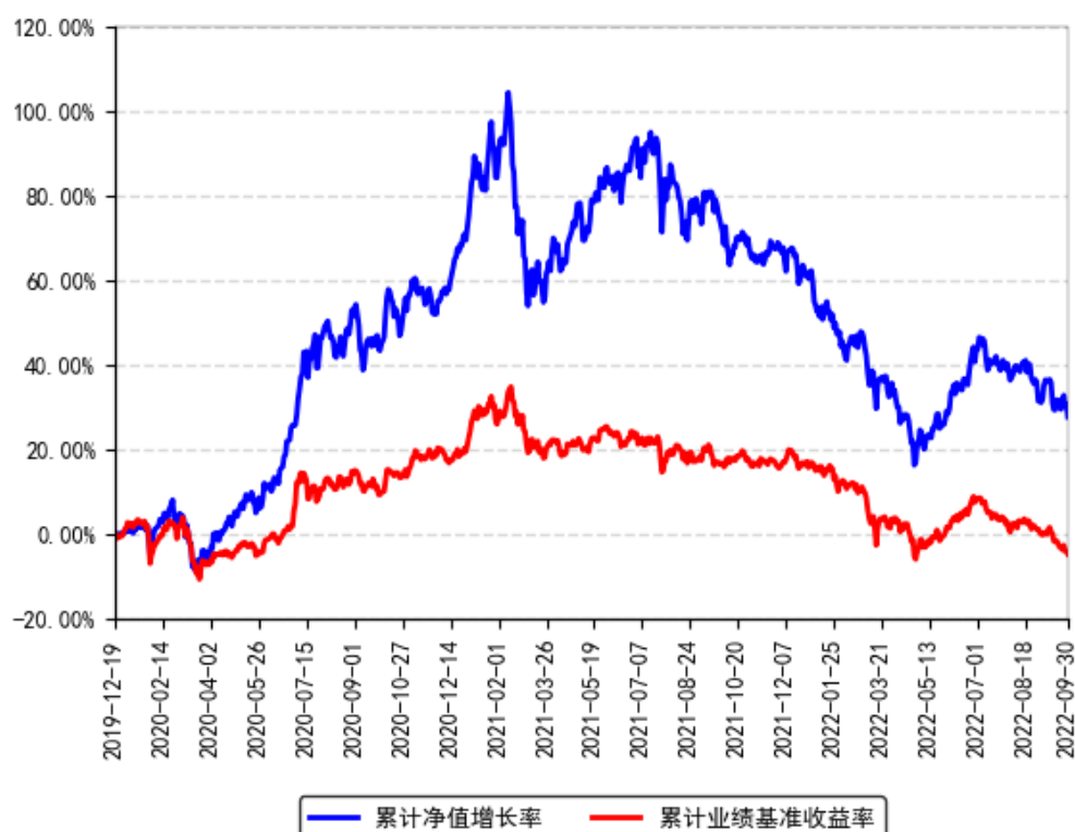
南方ESG主题股票A累计净值增长率与同期业绩比较基准收益率的历史走势对比图