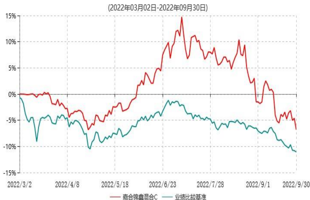
嘉合锦鑫混合C累计净值增长率与业绩比较基准收益率历史走势对比图

注：1、本基金合同于 2022 年 03 月 02 日生效，截至报告期末，本基金合同生效未满一年。