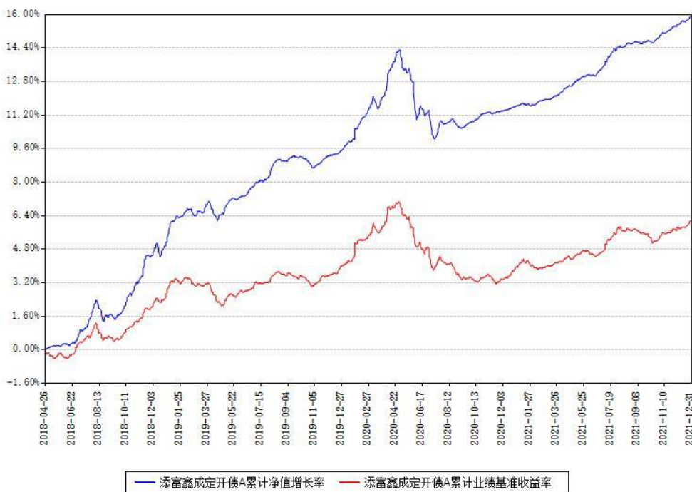
添富鑫成定开债A累计净值增长率与同期业绩基准收益率对比图

(二)自基金合同生效以来基金累计净值增长率变动及其与同期业绩比较基准收益率变动的比较图