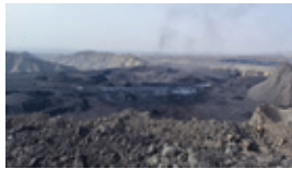
星亮礦的日常營運情況