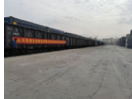
山東凱萊試用集裝箱運輸煤炭