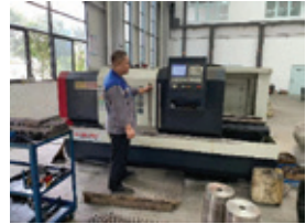
滕州凱源的日常營運情況