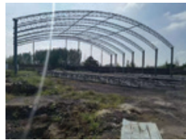
三號大棚的興建情況