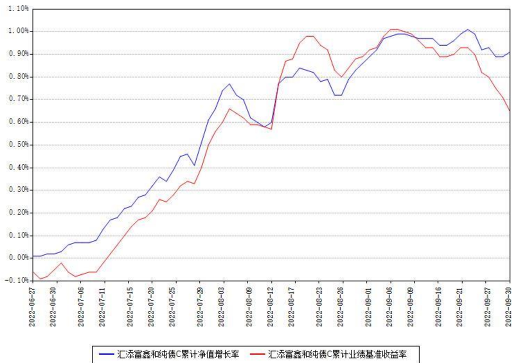
汇添富鑫和纯债C累计净值增长率与同期业绩基准收益率对比图