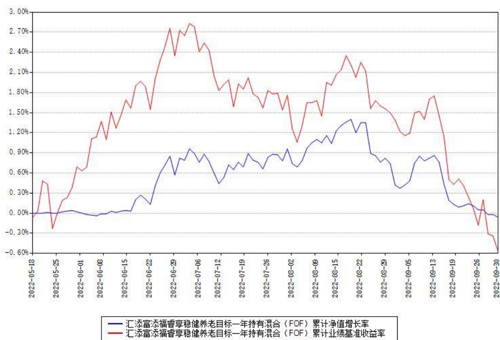
汇添富添福睿享稳健养老目标一年持有混合（FOF）累计净值增长率与同期业绩基准收益率对比图

(二) 自基金合同生效以来基金累计净值增长率变动及其与同期业绩比较基准收益率变动的比较图