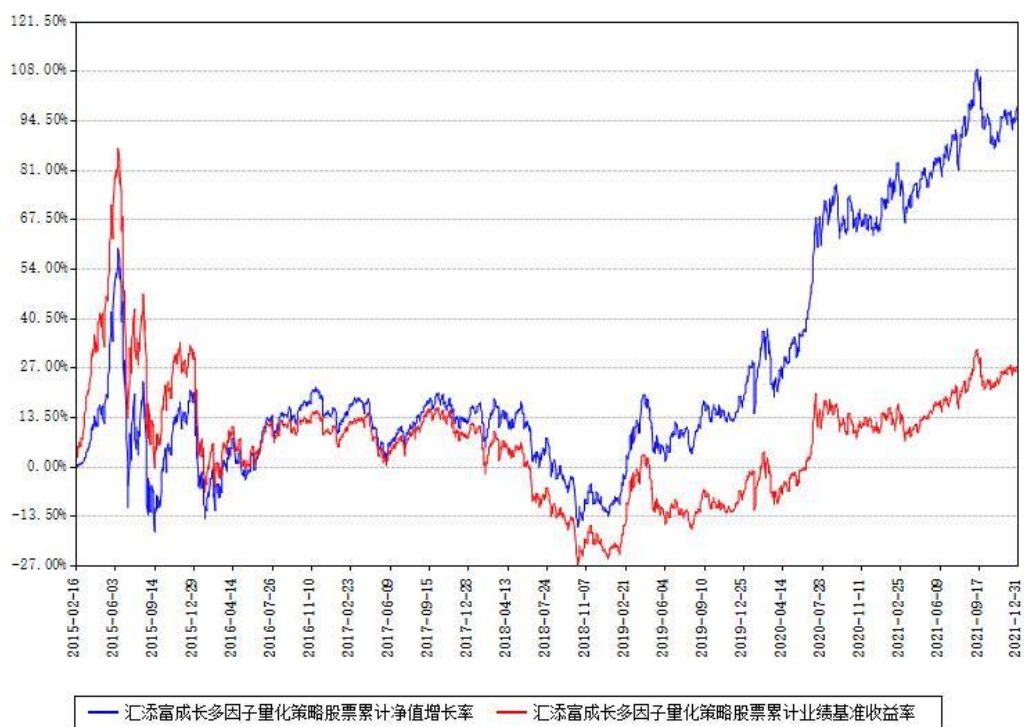
汇添富成长多因子量化策略股票累计净值增长率与同期业绩基准收益率对比图