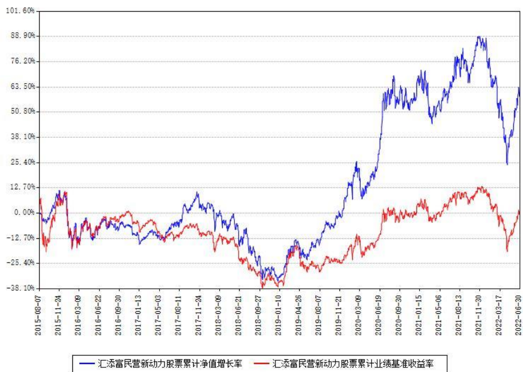
汇添富民营新动力股票累计净值增长率与同期业绩基准收益率对比图