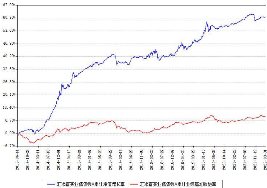
汇添富实业债债券A累计净值增长率与同期业绩基准收益率对比图