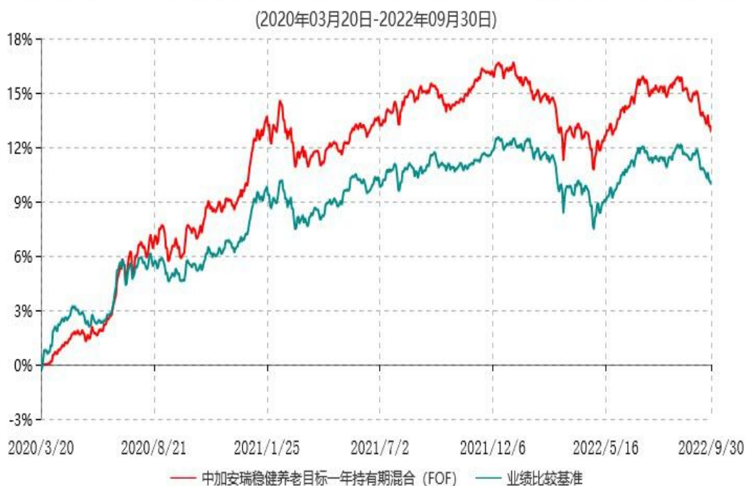
中加安瑞稳健养老目标一年持有期混合型基金中基金（FOF）累计净值增长率与业绩比较基准收益率历史走势对比图