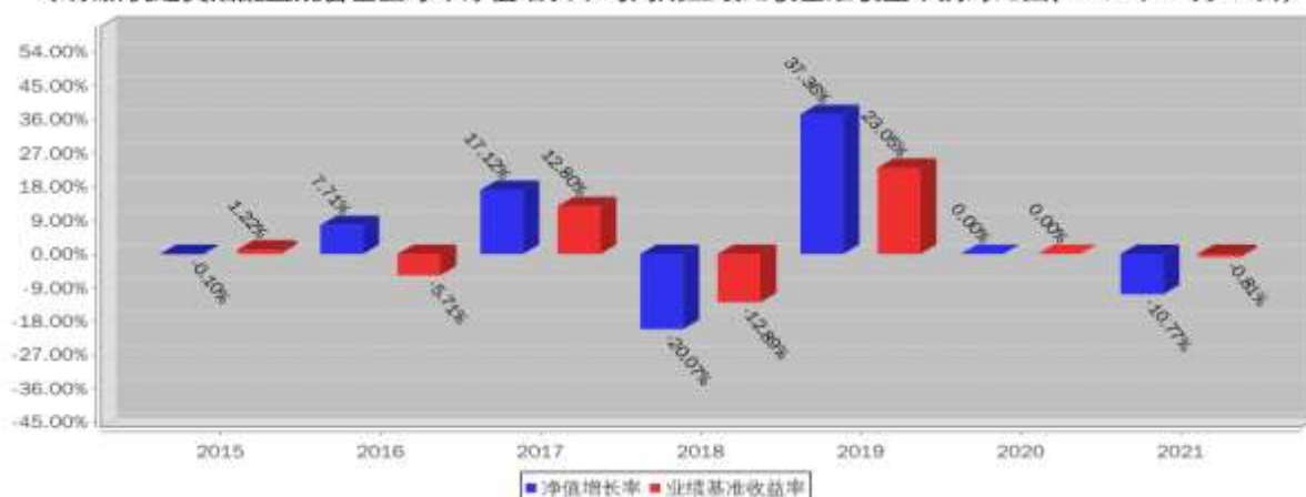
泰康新机遇灵活配置混合基金每年净值增长率与同期业绩比较基准收益率的对比图(2021年12月31日)

注:本基金成立于 2015 年 12 月 8 日, 2015 年度相关数据的计算期间为 2015 年 12 月 8 日至 2015 年 12 月 31 日, 图示业绩表现截止日期 2021 年 12 月 31 日。基金过往业绩不代表未来表现。