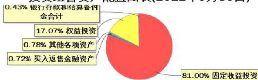
投资组合资产配置图表(2022年9月30日)

● 固定收益投资 ● 买入返售金融资产 ● 其他各项资产 ● 权益投资 ● 银行存款和结算备付金合计