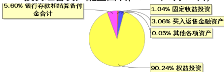
投资组合资产配置图表(2022年9月30日)

● 固定收益投资 ● 买入返售金融资产 ● 其他各项资产 ● 权益投资 ● 银行存款和结算备付金合计