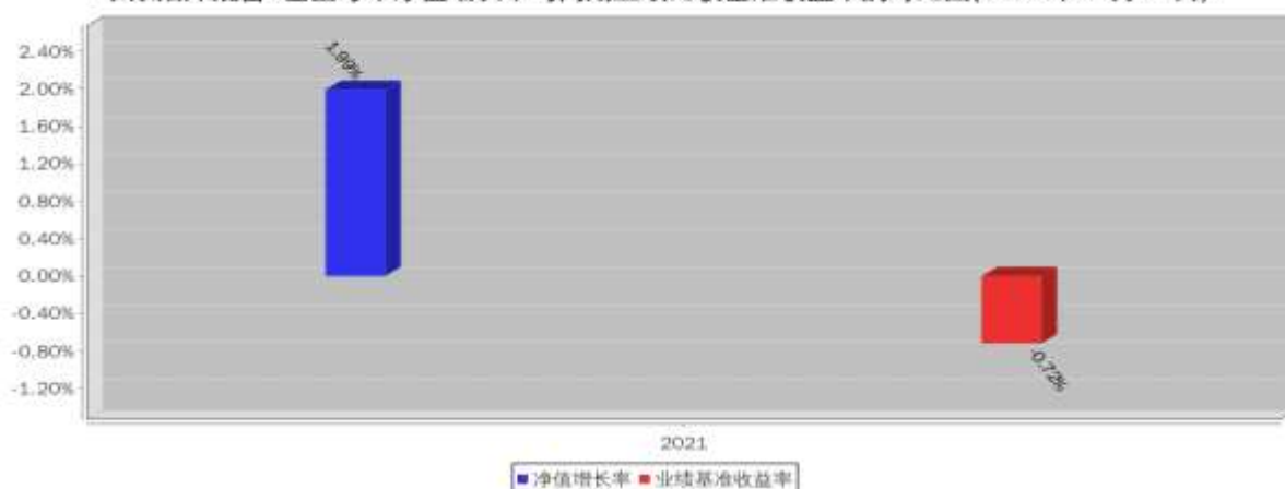
泰康浩泽混合A基金每年净值增长率与同期业绩比较基准收益率的对比图(2021年12月31日)

注:本基金成立于 2021 年 6 月 2 日, 2021 年度相关数据的计算期间为 2021 年 6 月 2 日至 2021 年 12 月 31 日, 图示业绩表现截止日期 2021 年 12 月 31 日。基金过往业绩不代表未来表现。