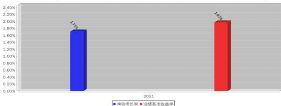
泰康安泽中短债A基金每年净值增长率与同期业绩比较基准收益率的对比图(2021年12月31日)

注:本基金成立于 2021 年 6 月 17 日, 2021 年度相关数据的计算期间为 2021 年 6 月 17 日至 2021 年 12 月 31 日, 图示业绩表现截止日期 2021 年 12 月 31 日。基金过往业绩不代表未来表现。