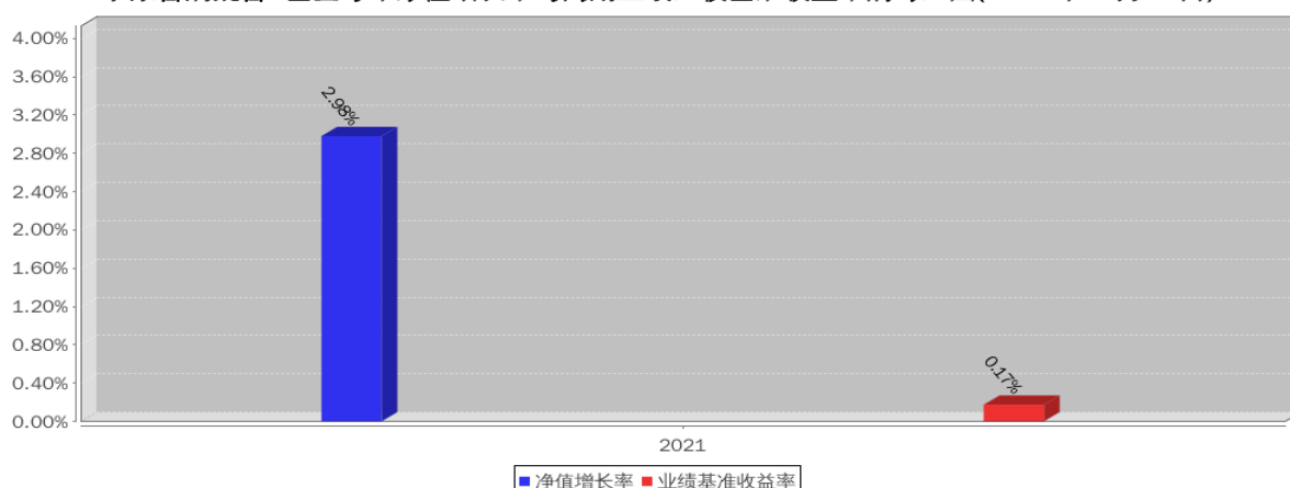
泰康合润混合C基金每年净值增长率与同期业绩比较基准收益率的对比图(2021年12月31日)

注:本基金成立于2021年4月7日,2021年度相关数据的计算期间为2021年4月7日至2021年12月31日,图示业绩表现截止日期2021年12月31日。基金过往业绩不代表未来表现。