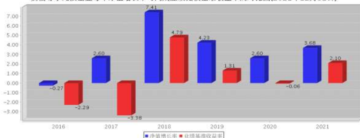
安信尊享纯债基金每年净值增长率与同期业绩比较基准收益率的对比图(2021年12月31日)

注：基金合同生效当年期间的相关数据按实际存续期计算。基金的过往业绩并不代表其未来表现。