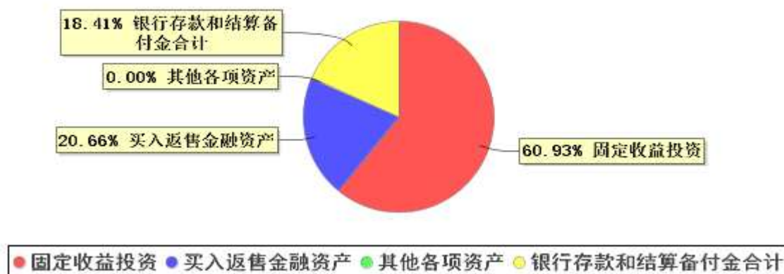
投资组合资产配置图表(2022年9月30日)