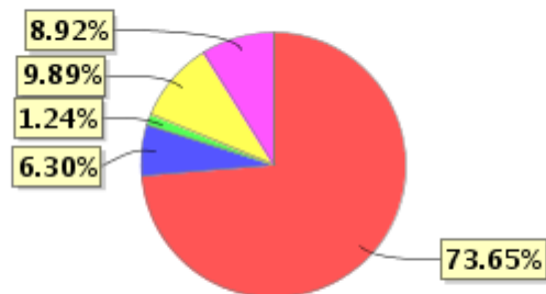
投资组合资产配置图表(2021年12月31日)

● 固定收益投资 ● 买入返售金融资产 ● 其他各项资产 ● 权益投资 ● 银行存款和结算备付金合计