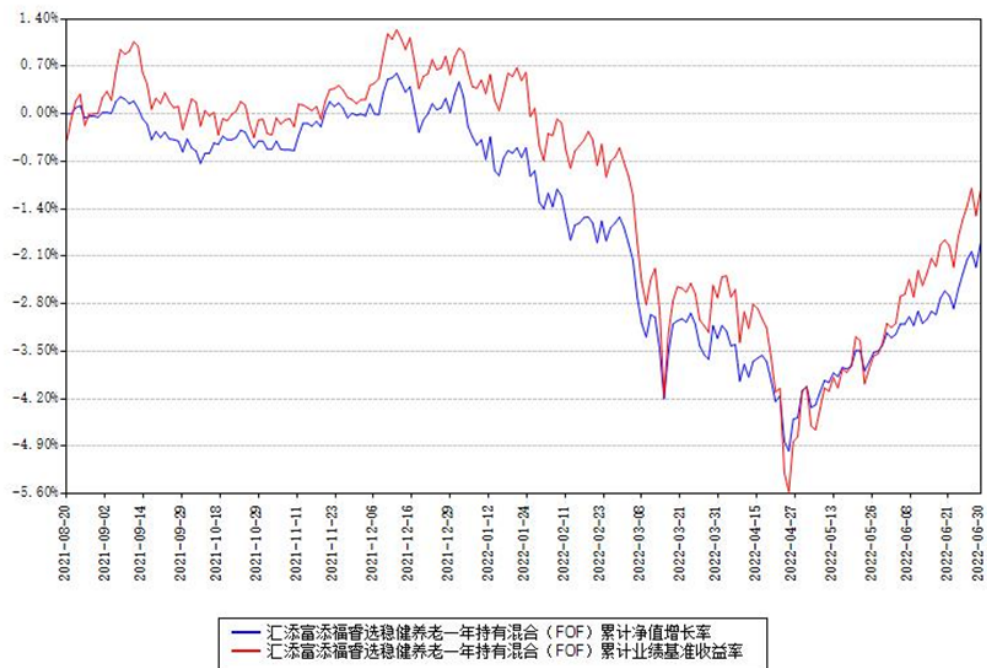
汇添富添福睿选稳健养老一年持有混合（FOF）累计净值增长率与同期业绩基准收益率对比图