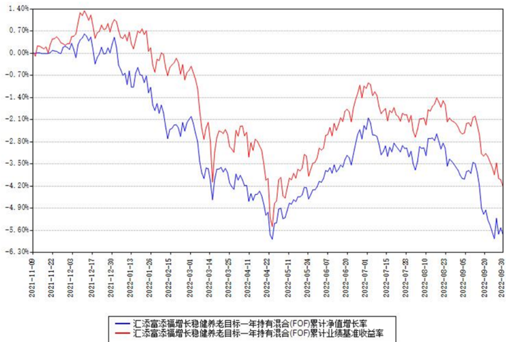
汇添富添福增长稳健养老目标一年持有混合(FOF)累计净值增长率与同期业绩基准收益率 对比图