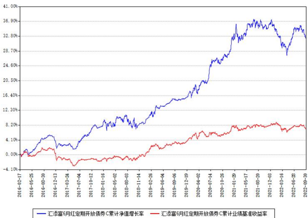
汇添富6月红定期开放债券C累计净值增长率与同期业绩基准收益率对比图