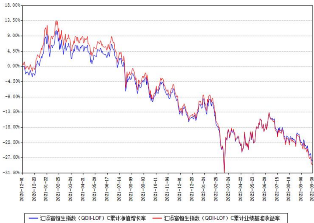
汇添富恒生指数 (QDII-LOF) C 累计净值增长率与同期业绩基准收益率对比图