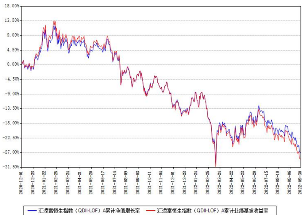
汇添富恒生指数 (QDII-LOF) A 累计净值增长率与同期业绩基准收益率对比图