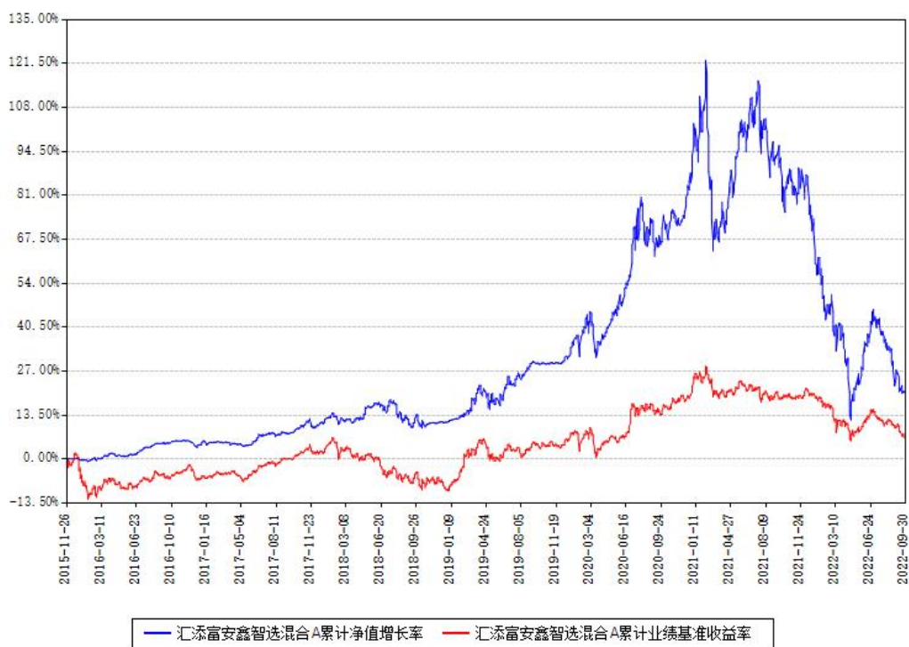
汇添富安鑫智选混合A累计净值增长率与同期业绩基准收益率对比图