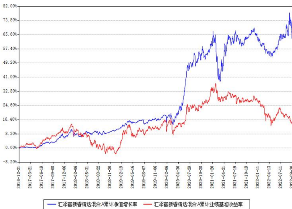
汇添富新睿精选混合A累计净值增长率与同期业绩基准收益率对比图

(二) 自基金合同生效以来基金累计净值增长率变动及其与同期业绩比较基准收益率变动的比较图