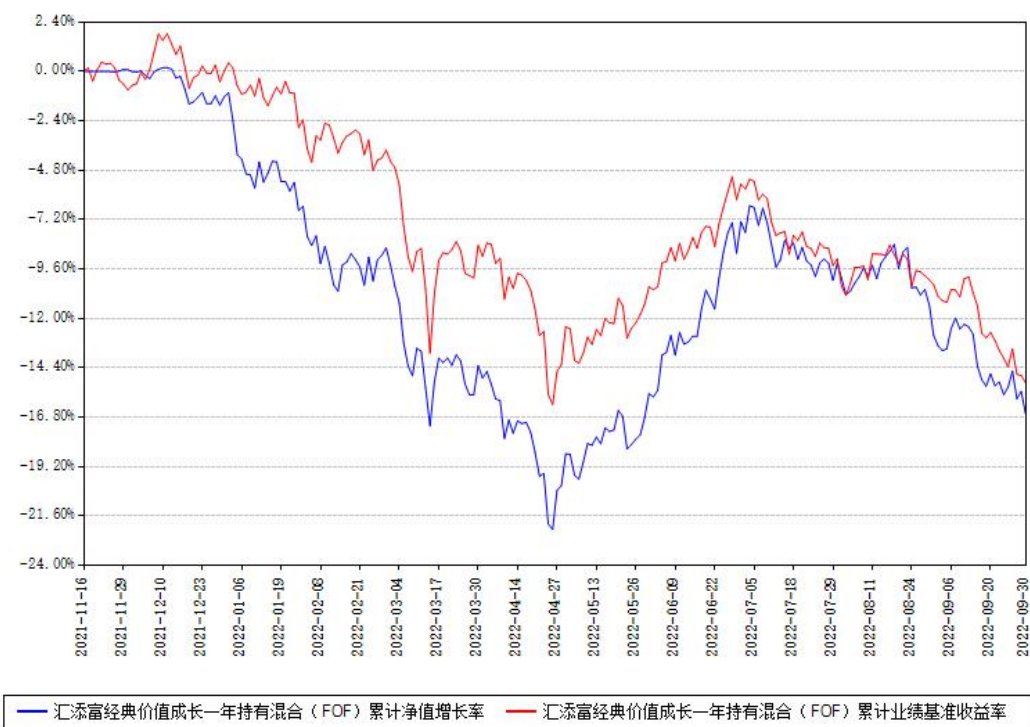
汇添富经典价值成长一年持有混合（FOF）累计净值增长率与同期业绩基准收益率对比图