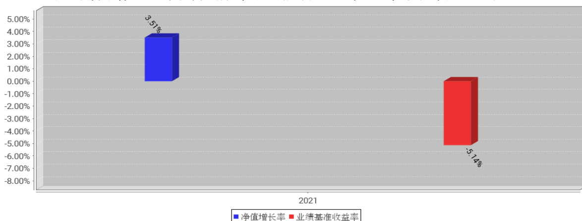
工银核心优势混合C基金每年净值增长率与同期业绩比较基准收益率的对比图（2021年12月31日）

注：1、本基金基金合同于2021年6月24日生效。合同生效当年不满完整自然年度的，按实际期限计算净值增长率。