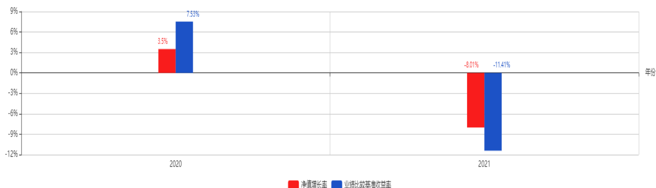
基金每年的净值增长率及与同期业绩比较基准的比较图

注：业绩表现截止日期 2021 年 12 月 31 日。基金过往业绩不代表未来表现。