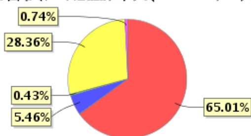
投资组合资产配置图表(2022年9月30日)

● 固定收益投资 ● 买入返售金融资产 ● 其他各项资产 ● 权益投资 ● 银行存款和结算备付金合计