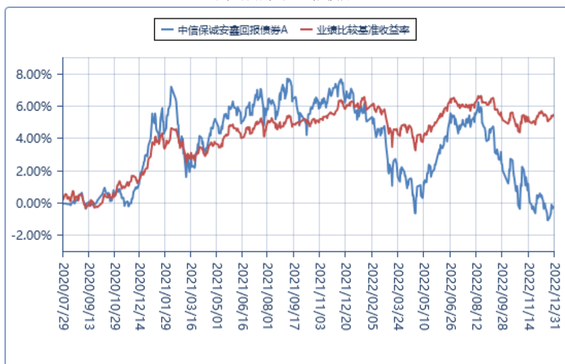
中信保诚安鑫回报债券 C