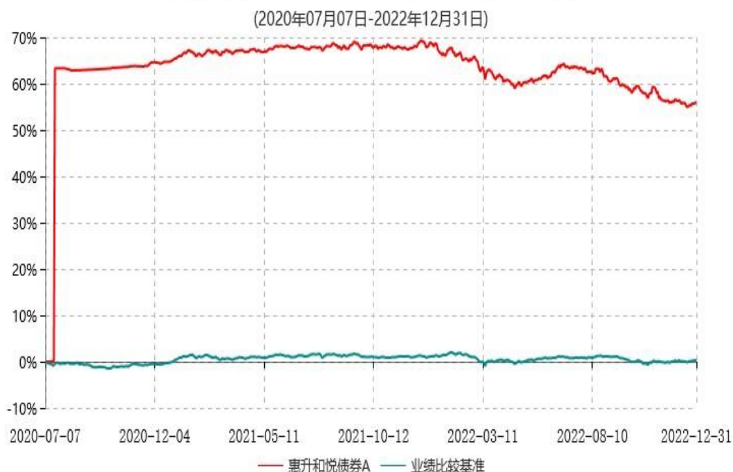
惠升和悦债券A累计净值增长率与业绩比较基准收益率历史走势对比图