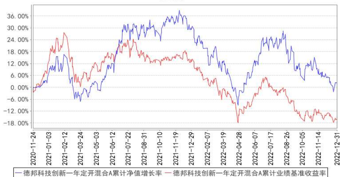
德邦科技创新一年定开混合A累计净值增长率与同期业绩比较基准收益率的历史走势对比图