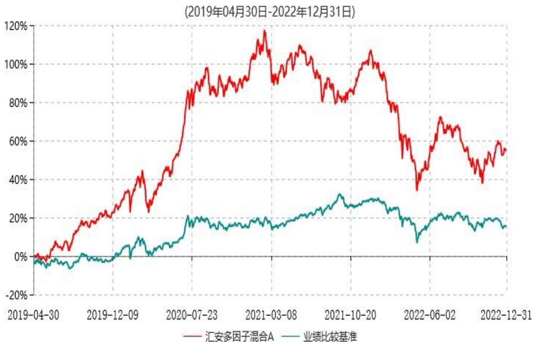
汇安多因子混合A累计净值增长率与业绩比较基准收益率历史走势对比图