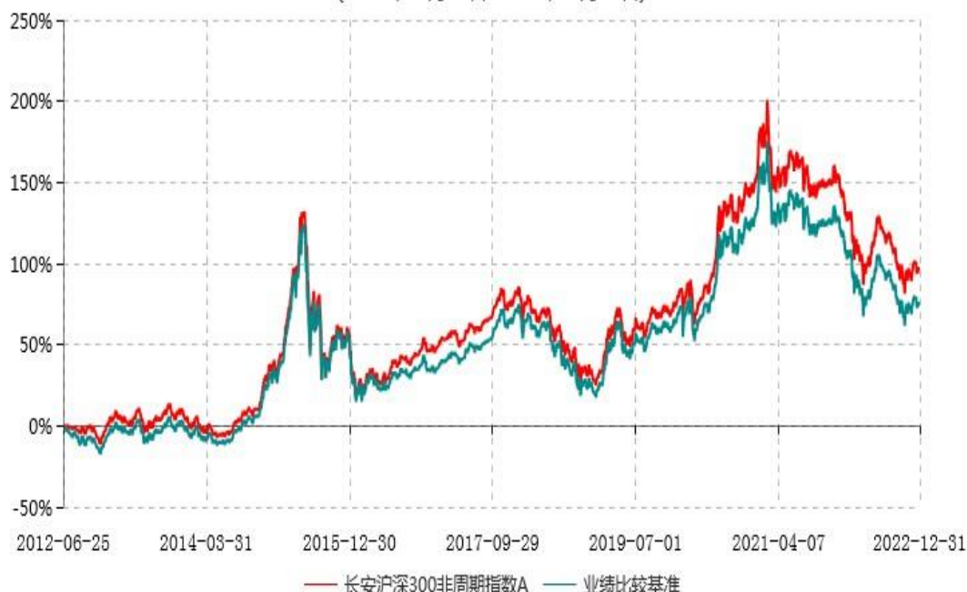
长安沪深300非周期指数A累计净值增长率与业绩比较基准收益率历史走势对比图 (2012年06月25日-2022年12月31日)

根据基金合同的规定,自基金合同生效之日起 6 个月内基金各项资产配置比例需符合基金合同要求。本基金在建仓期结束后,各项资产配置比例已符合基金合同有关投资比例的约定。基金合同生效日至报告期期末,本基金运作时间超过一年,图示日期为 2012 年 06 月 25 日至 2022 年 12 月 31 日。