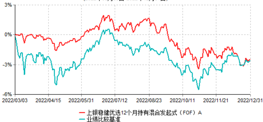
上银稳健优选12个月持有混合发起式（FOF）A累计净值增长率与业绩比较基准收益率历史走势对比图 (2022年03月03日-2022年12月31日)