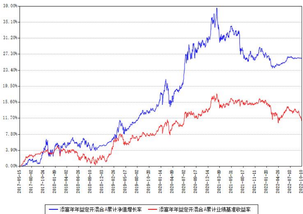
添富年年益定开混合A累计净值增长率与同期业绩基准收益率对比图