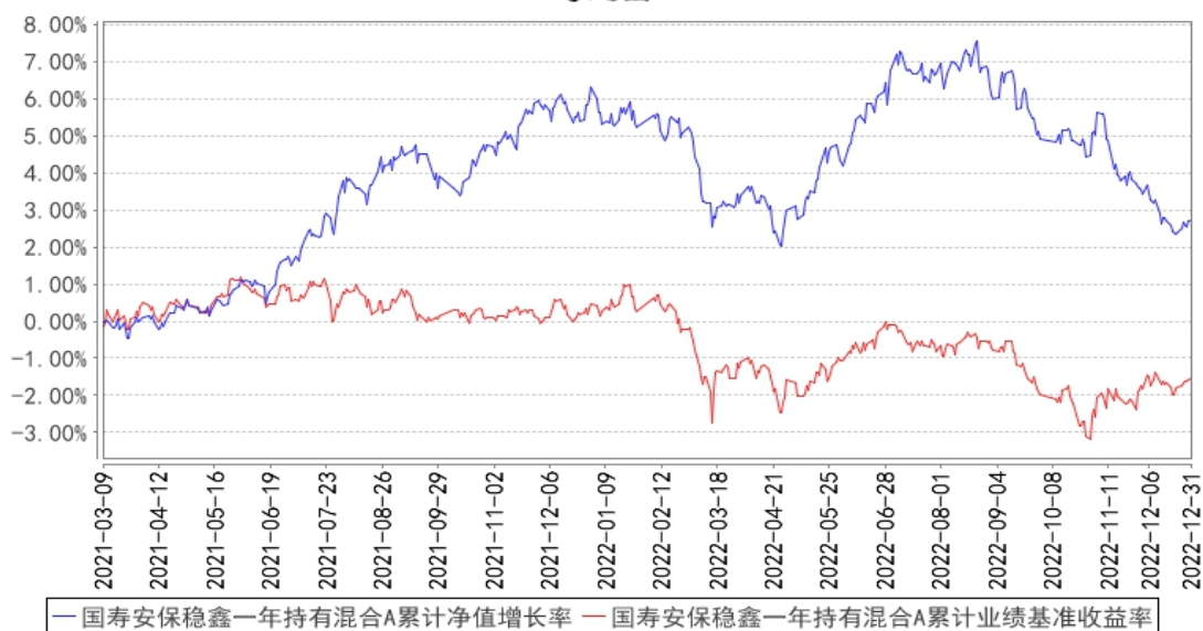
国寿安保稳鑫一年持有混合A累计净值增长率与同期业绩比较基准收益率的历史走势对比图